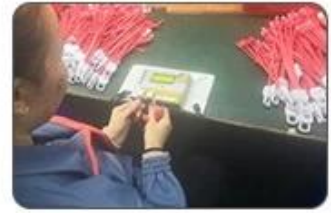
6 Final inspection