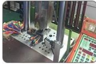
5. Ultrasound closing