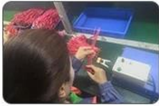
4 Welding checking