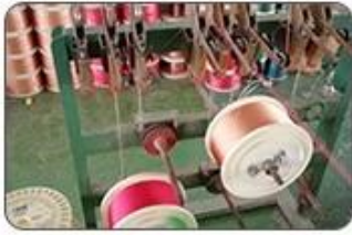
1 Making cable body