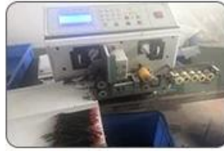
2 Cutting Cables