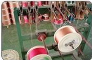
1 Making cable body