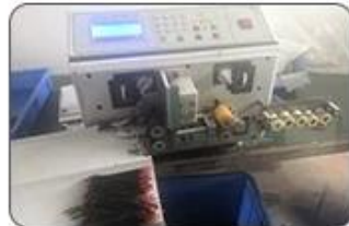
2 Cutting Cables