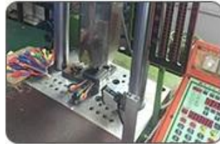
5. Ultrasound closing