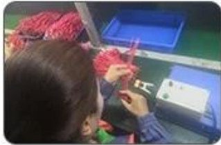
4 Welding checking