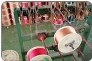
1 Making cable body