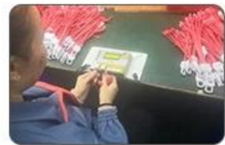
6 Final inspection