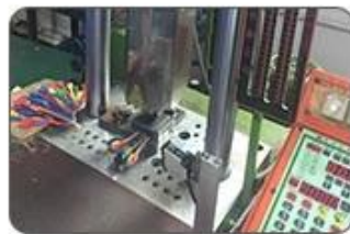
5. Ultrasound closing