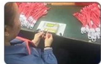
6 Final inspection