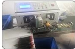
2 Cutting Cables