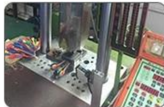
5. Ultrasound closing