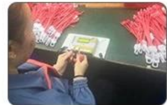
6 Final inspection