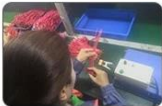
4 Welding checking