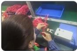
4 Welding checking