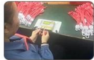
6 Final inspection