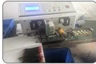
2 Cutting Cables