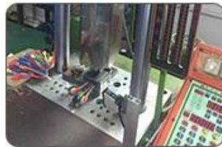
5. Ultrasound closing