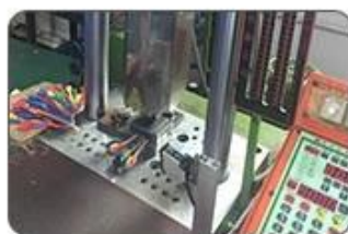
5. Ultrasound closing