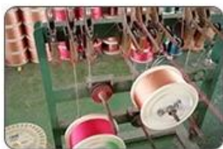
1 Making cable body