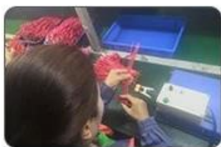
4 Welding checking