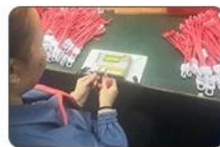
6 Final inspection