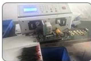
2 Cutting Cables