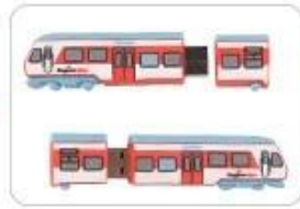
14. Finished products