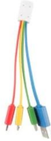
Figure 2: 5-pin connector