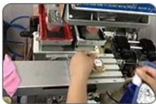
7 Logo printing