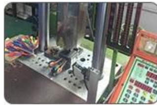
5. Ultrasound closing