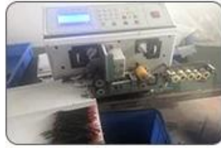
2 Cutting Cables