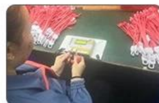
6 Final inspection