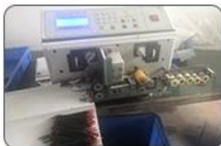
2 Cutting Cables