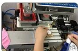
7 Logo printing