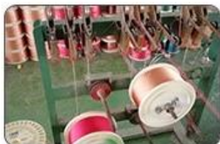
1 Making cable body