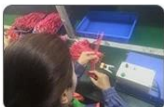
4 Welding checking