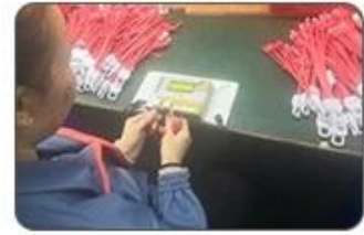
6 Final inspection