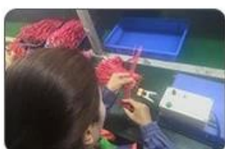
4 Welding checking