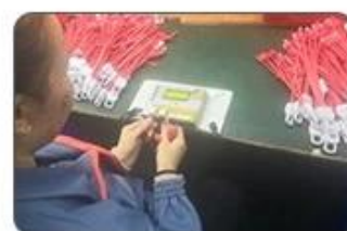
6 Final inspection