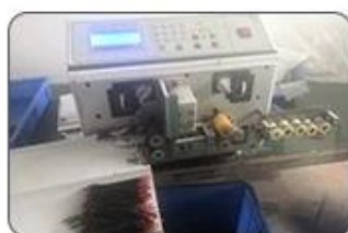
2 Cutting Cables