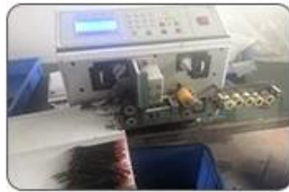
2 Cutting Cables