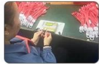
6 Final inspection