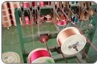
1 Making cable body