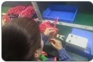
4 Welding checking