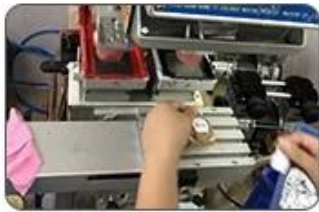
7 Logo printing