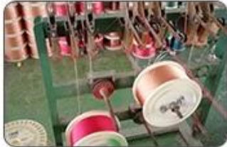
1 Making cable body