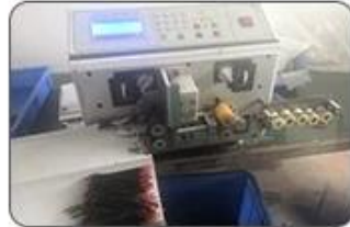
2 Cutting Cables