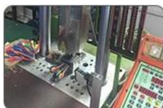
5. Ultrasound closing