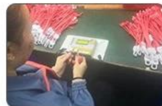
6 Final inspection