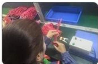
4 Welding checking