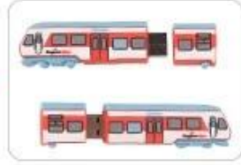
14. Finished products