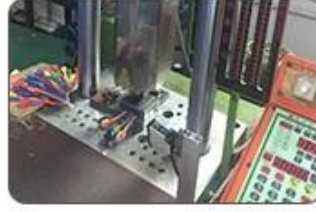
5. Ultrasound closing