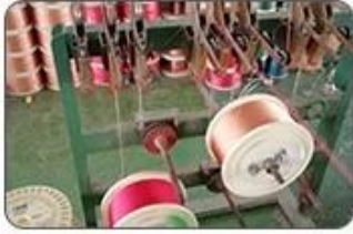
1 Making cable body