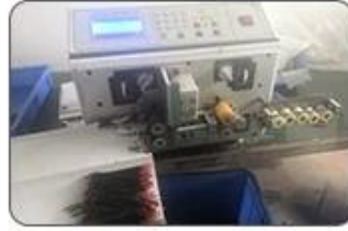
2 Cutting Cables