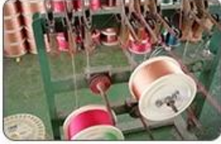
1 Making cable body