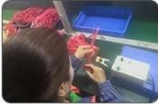
4 Welding checking