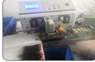
2 Cutting Cables