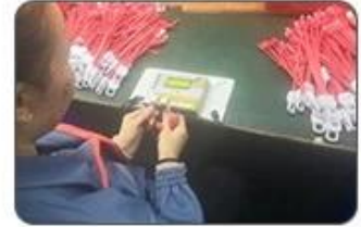
6 Final inspection