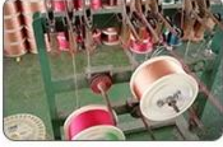
1 Making cable body