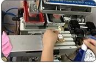
7 Logo printing