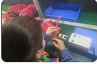
4 Welding checking