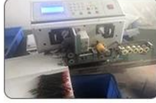
2 Cutting Cables