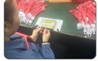
6 Final inspection