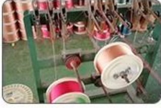
1 Making cable body