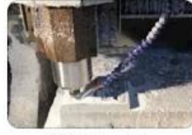
3. Mold making