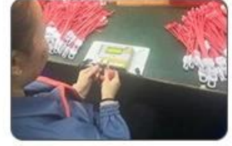
6 Final inspection