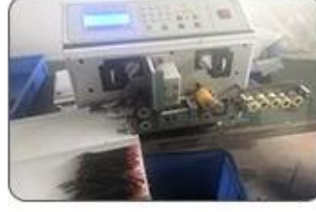
2 Cutting Cables